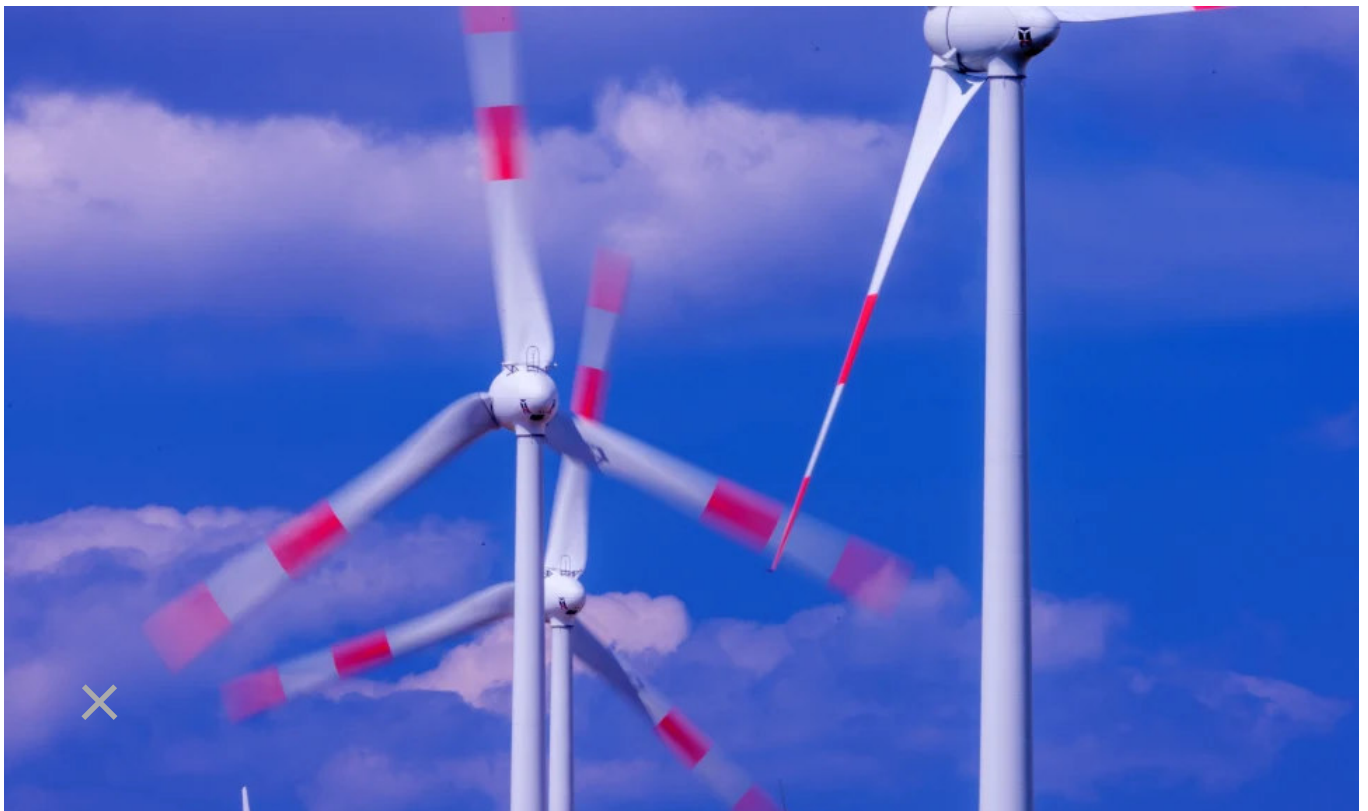
Was tun, wenn der Wind nicht weht und die Sonne nicht scheint? Windräder in Mecklenburg-Vorpommern.